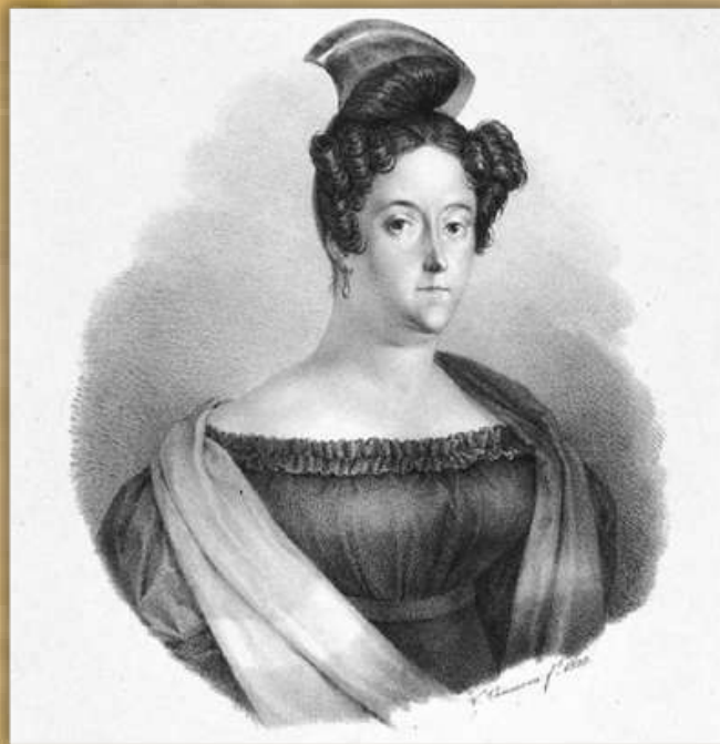
Antera Baus: actriz cartagenera