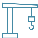
Grúa para WC