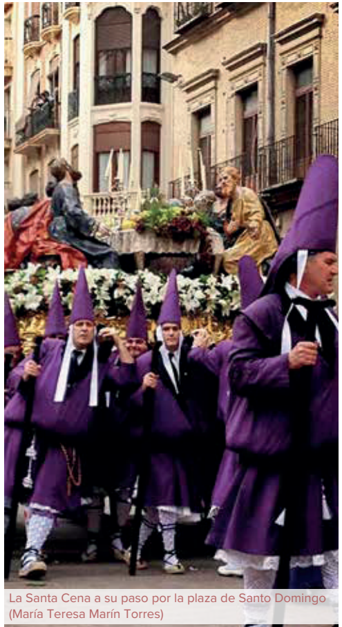
La Santa Cena a su paso por la plaza de Santo Domingo

Clausura de las XXVI Jornadas de Patrimonio Cultural de la Región de Murcia.