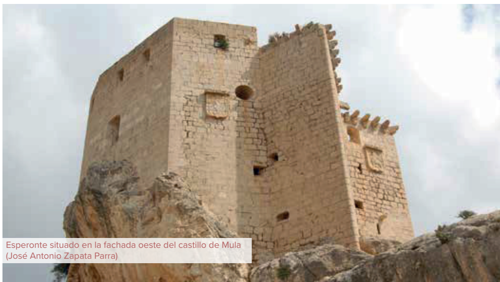
Esperonte situado en la fachada oeste del castillo de Mula (José Antonio Zapata Parra)