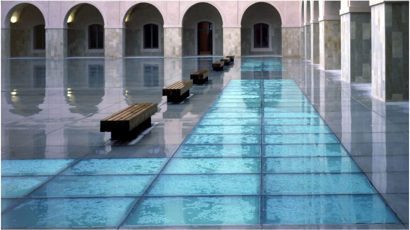
PATIO INTERIOR DE LA ESCUELA TÉCNICA SUPERIOR DE INGENIERÍA INDUSTRIAL DE LA UNIVERSIDAD POLITÉCNICA DE CARTAGENA.

6-DISTRIBUCIÓN BECAS-COLABORACIÓN DEL MINISTERIO DE EFP. PREMIO IN MEMORIAM GINÉS HUERTAS MARTÍNEZ A LA SUPERACIÓN Y EL ESFUERZO. BECAS DE EXCELENCIA DEL CONSEJO SOCIAL, EN COLABORACIÓN CON FUNDACIÓN REPSOL, Y PREMIOS ISAAC PERAL DEL CONSEJO SOCIAL.