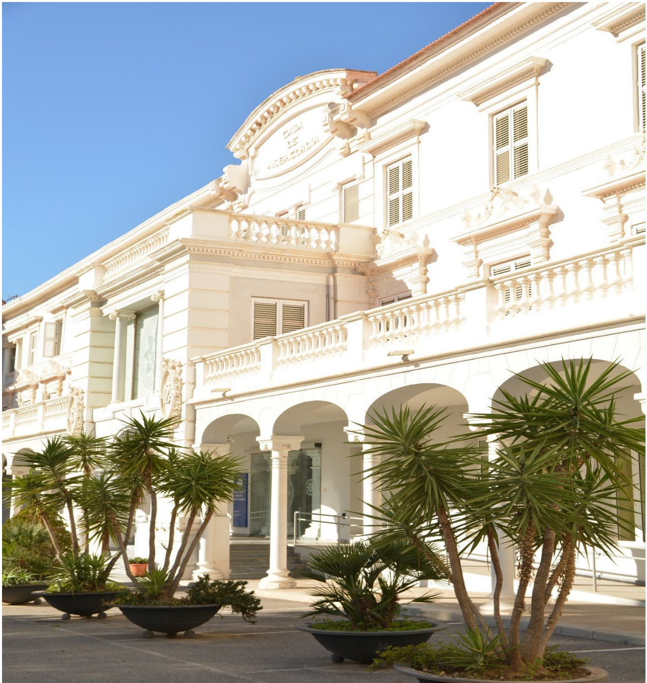
EDIFICIO “LA MILAGROSA” SEDE DEL RECTORADO DE LA UNIVERSIDAD POLITÉCNICA DE CARTAGENA.