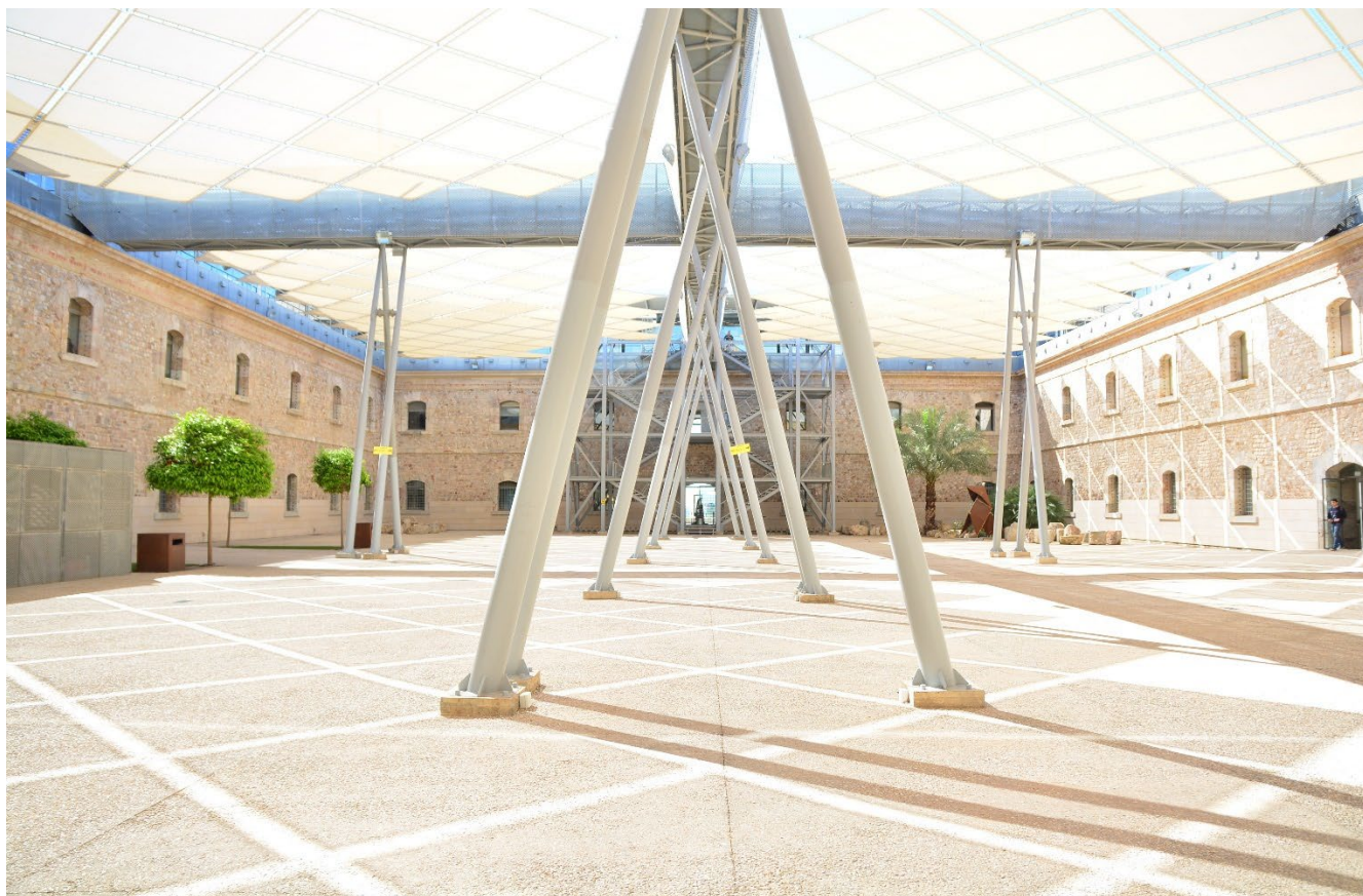
PATIO CENTRAL DE LA FACULTAD DE CIENCIAS DE LA EMPRESA (ANTIGUO CUARTEL DE INSTRUCCIÓN DE MARINERÍA) DE LA UNIVERSIDAD POLITÉCNICA DE CARTAGENA.