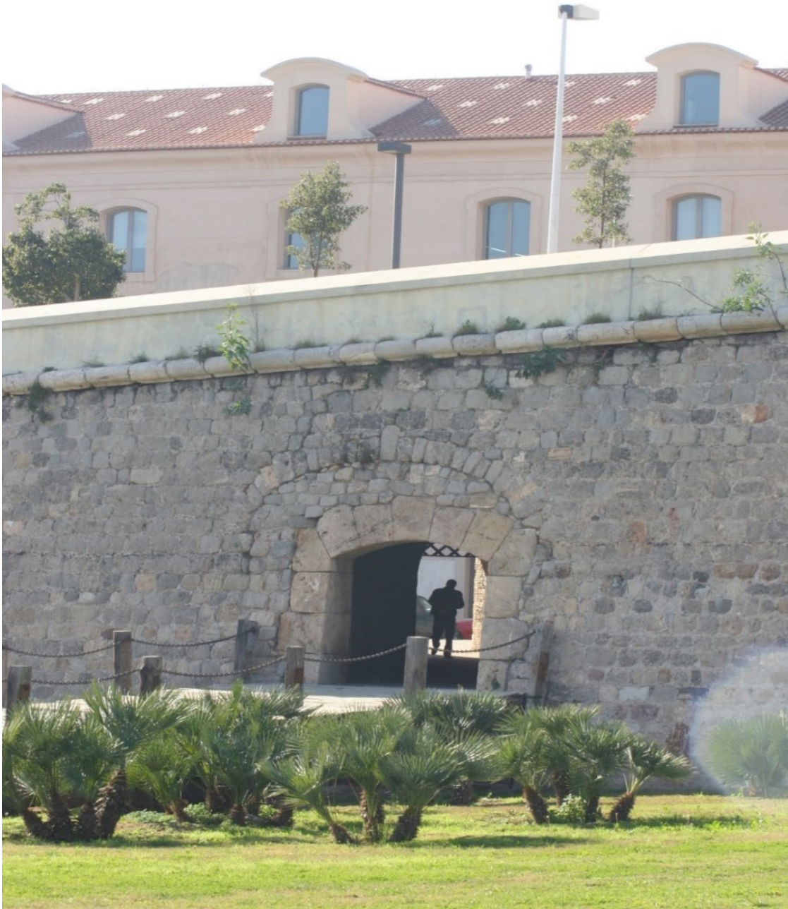
POTERNA DEL HOSPITAL DE MARINA – MURALLA DE CARLOS V- CAMPUS DE LA MURALLA DEL MAR. VISTA LATERAL DE LA ETS DE INGENIERÍA INDUSTRIAL DE LA UNIVERSIDAD POLITÉCNICA DE CARTAGENA.