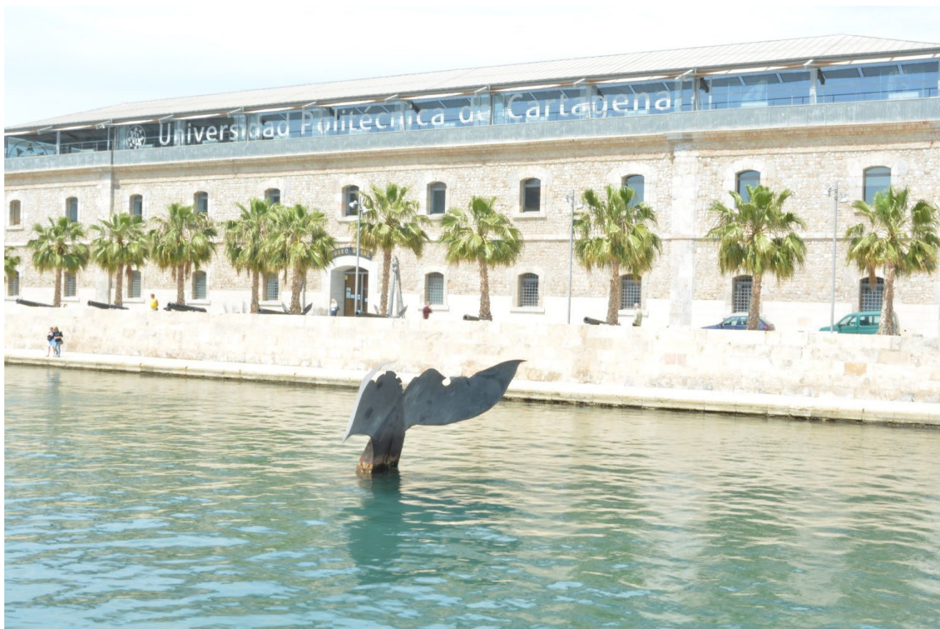
VISTA PARCIAL DE LA FACULTAD DE CIENCIAS DE LA EMPRESA Y LA ESCUELA TÉCNICA SUPERIOR DE ARQUITECTURA Y EDIFICACIÓN DE LA UNIVERSIDAD POLITÉCNICA DE CARTAGENA.