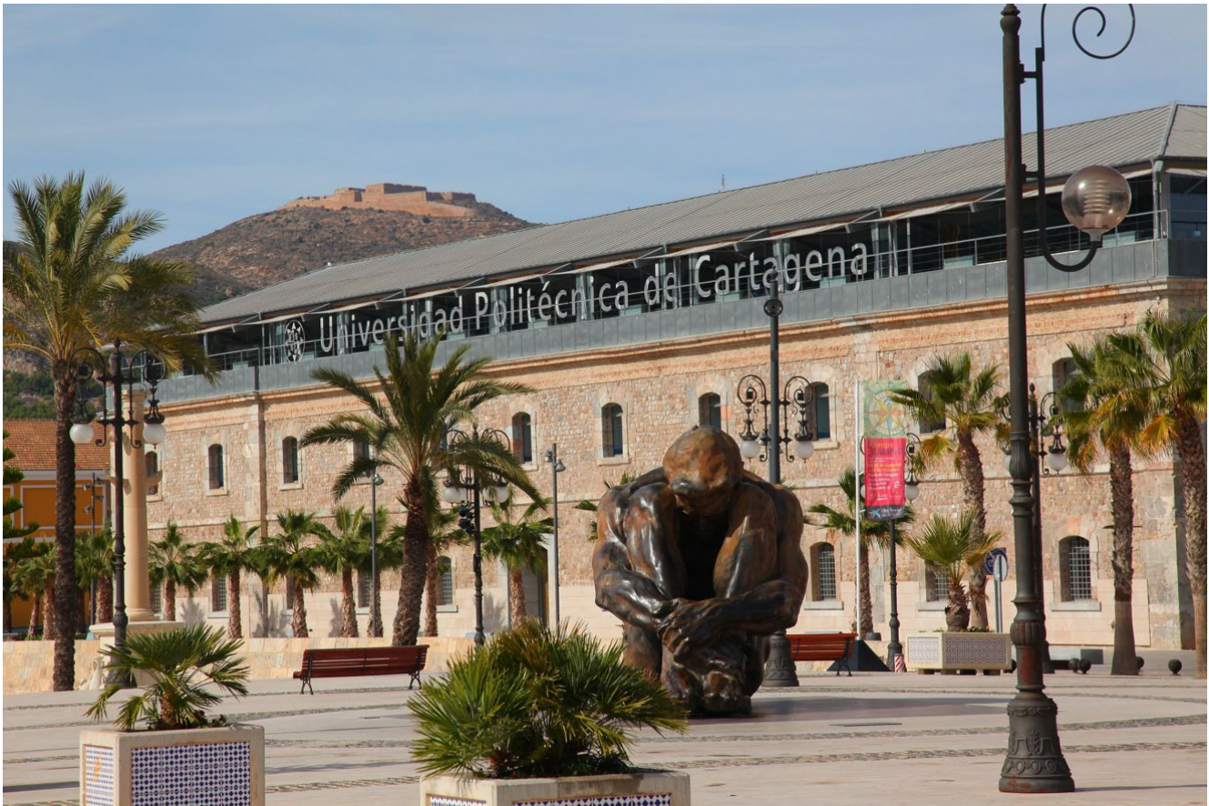
VISTA LATERAL DE LA FACULTAD DE CIENCIAS DE LA EMPRESA, Y ESCUELA TÉCNICA SUPERIOR DE ARQUITECTURA Y EDIFICACIÓN DE LA UNIVERSIDAD POLITÉCNICA DE CARTAGENA