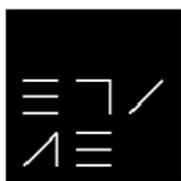
Escuela Técnica Superior de Arquitectura y Edificación Cartagena

Profesionales del sector de la construcción, técnicos de la administración, promotores, empresas constructoras, titulados, estudiantes y todo aquel interesado en el desarrollo del sector de la construcción en la Región de Murcia a través de la Innovación.