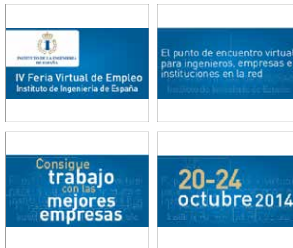
Fotogramas de banner 2014