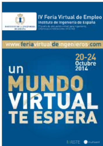
Cartel Promocional 2014

Esta web será el principal elemento de promoción on-line , ya que todos los links publicados dirigirán directamente a ella.