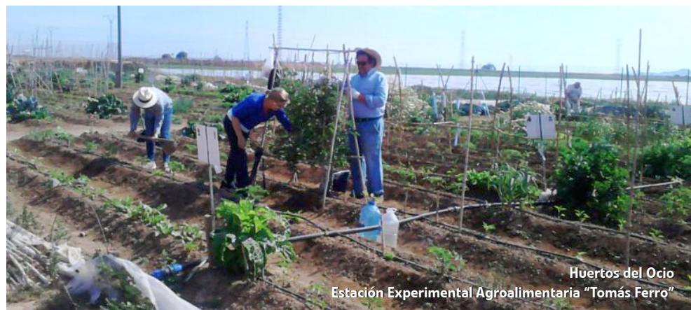
Huertos del Ocio Estación Experimental Agroalimentaria "Tomás Ferro"

El Aula Permanente de Mayores, está dirigida a personas mayores de 50 años con independencia de la formación académica que posean. También podrán participar aquellos que, sin haber llegado a esta edad, acrediten estar jubilados, prejubilados o en situación de reserva, siempre y cuando no se hayan cubierto las plazas inicialmente ofertadas. A estas acciones de formación podrán acceder tanto antiguos alumnos de la Universidad de Mayores como otras personas mayores no vinculadas a ella.