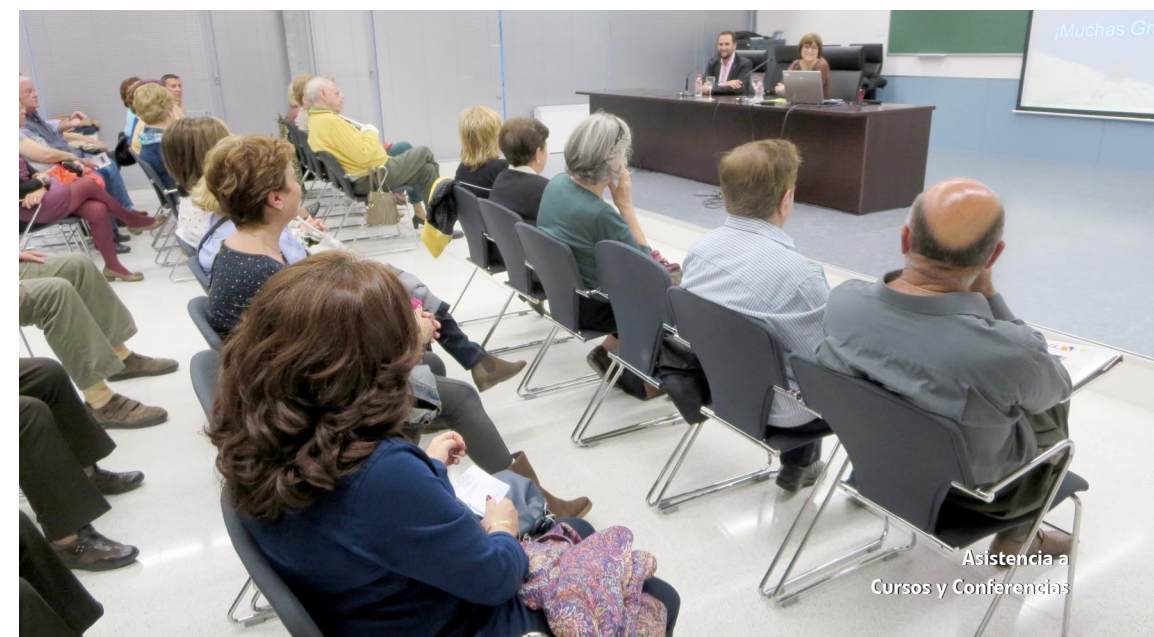
Asistencia a Cursos y Conferencias

El importe para cada uno de los talleres será de 20 euros.