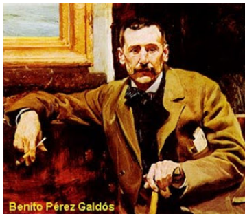
Benito Pérez Galdós