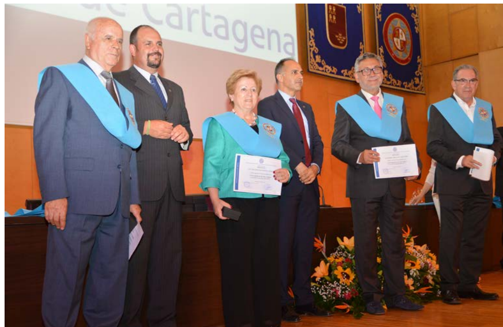
Acto de Graduación 2017

Obtención de Diploma Una vez finalizado el citado "Curso Senior", la UPCT le otorgará la correspondiente acreditación académica mediante un diploma de la UPCT, que no faculta para el ejercicio de una profesión.