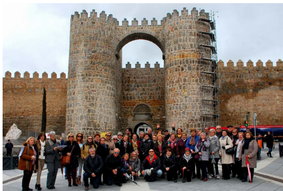
Viaje de Estudios 2018

DOCUMENTACIÓN: Impreso de matrícula debidamente cumplimentado y firmado; Resguardo de ingreso del importe de matrícula; Dos fotografías tamaño carné; Fotocopia del D.N.I.